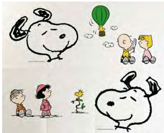
Art.Nr. B 1700

PEANUTS © United Feature Syndicate, Inc.